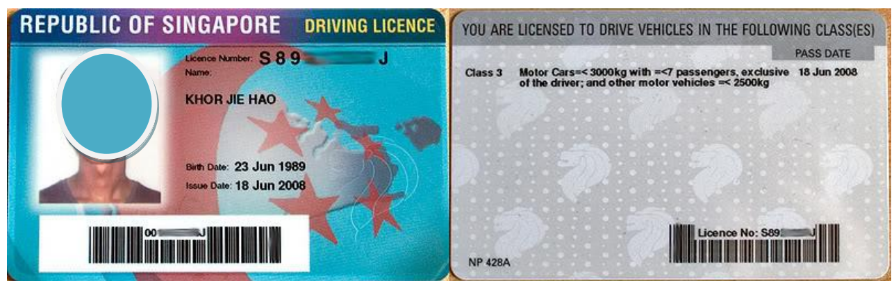
ตัวอย่างใบอนุญาตขับขี่ของประเทศสิงคโปร์